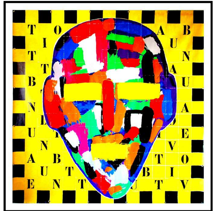
Tout va bien (grand anonyme), 210x210 cm, 1994

Depuis la peinture à la bombe aérosol et à la laque industrielle en passant par le travail sur le zinc et le bois, la naissance de leur emblématique Zuman et toutes les déclinaisons de cet artefact, l'exposition permet de (re)découvrir le travail de ces piliers du street art français.