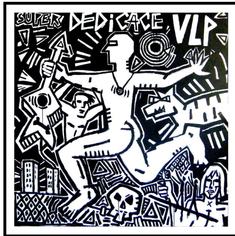
Super dédicace, 150x150 cm, 2011

Depuis l'organisation en 1985 à Bondy du premier rassemblement international des graffitistes, le long du canal de l'Ourcq avec notamment Miss.Tic, Speedy Graphito, SP 38, Epsilon Point, Futura 2000, Blek le Rat, Jef Aérosol, en passant par les tournées en Allemagne de la décennie 1990, la création du personnage Zuman en 2000 puis de Zuman Kojito et leur travail de sculptures, ils ont fêté 40 années de création en 2023.