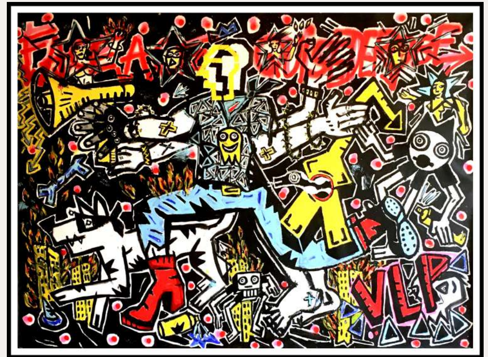
Face à ce qui se dérobe, 220x302 cm, performance au Consulat, le 12 octobre 2018

L'identification, la localisation et la réunion d'œuvres majeures constituent un défi pour le montage d'une exposition rétrospective. Pour chaque période, des pièces remarquables et exceptionnelles ont pu être réunies. C'est donc un florilège d'œuvres très fortes et de qualité qui est présenté.