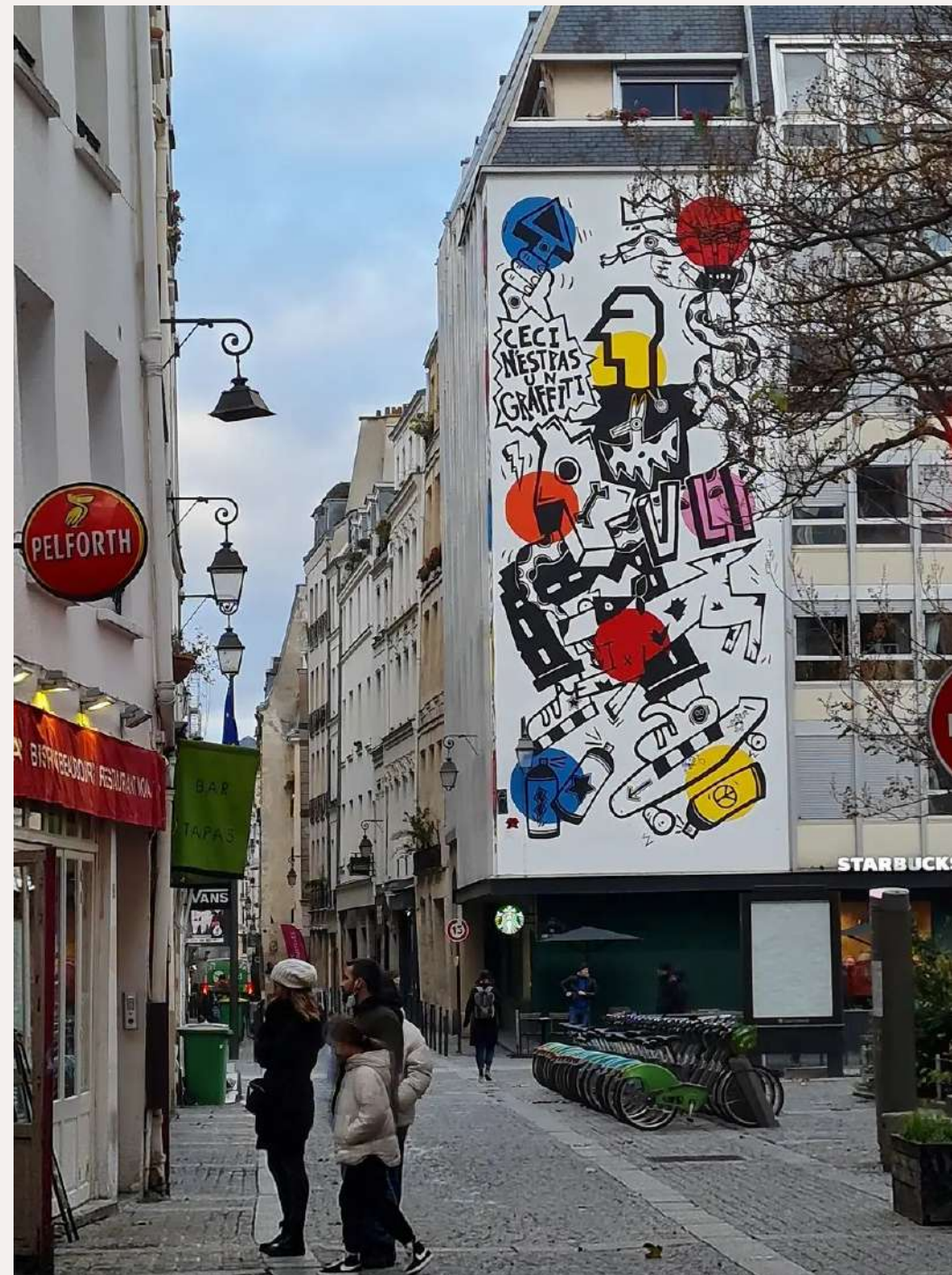
Fresque Ceci n'est pas un graffiti de Beaubourg, 2016

Continuer à avancer ! La peinture est un long chemin au long duquel nous levons les lièvres de la modernité !