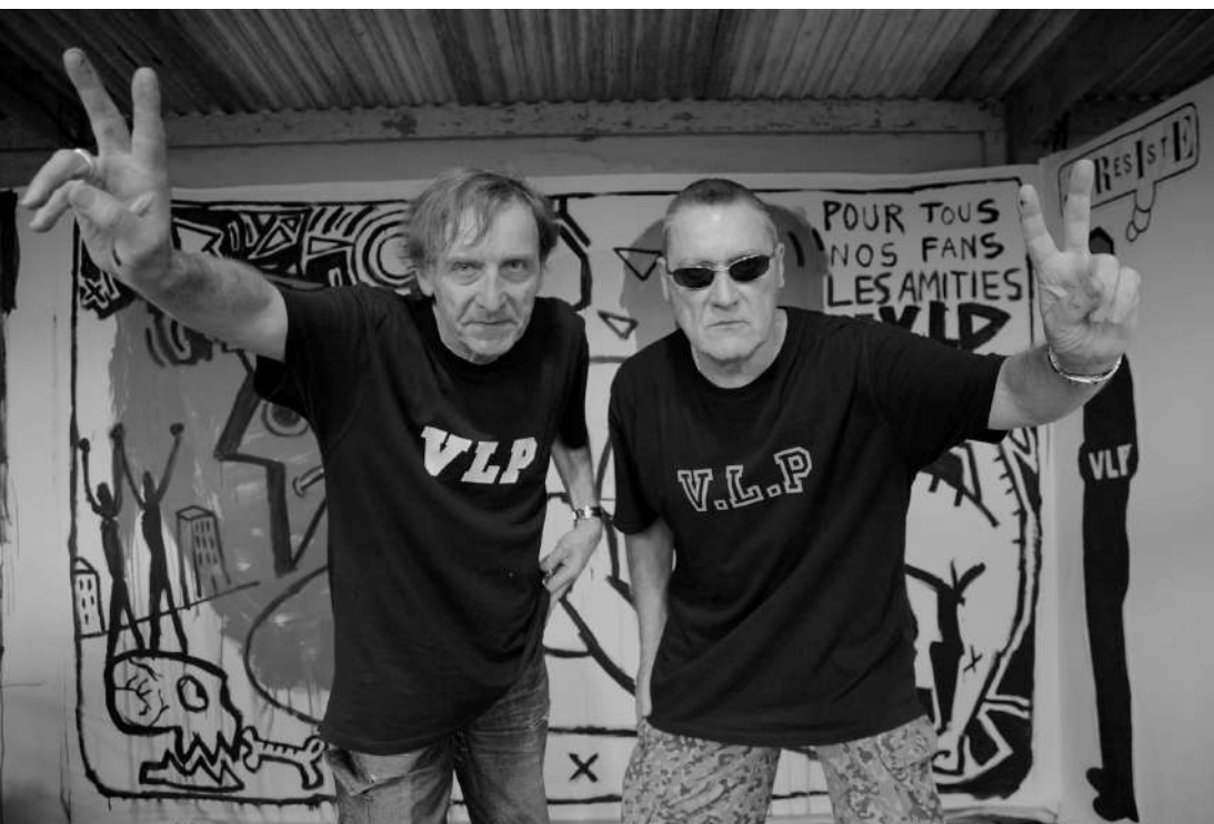
VLP par @Philippe Bonan

Trois lettres pour désigner l'un des collectifs de graffeurs les plus connus de France.